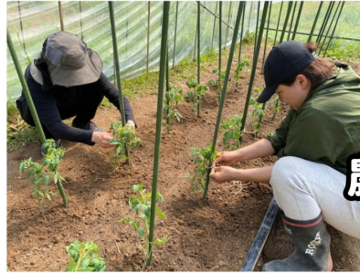
自然農法による農作業