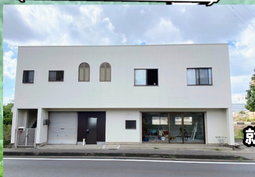
就労継続支援B型事業所 そらまめ