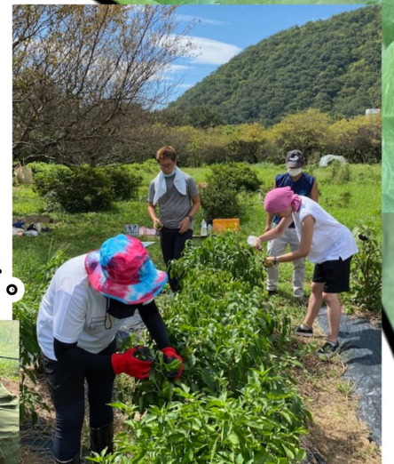
農場 風のとおりみち

依存症(薬物・アルコール・ギャンブル・摂食障害)の問題を抱えていらっしゃる、一般企業で働く自信がまだ持てないなどの不安がある方に、就労の機会を提供し、就労に必要な知識・能力の向上のために訓練を行う場所です。